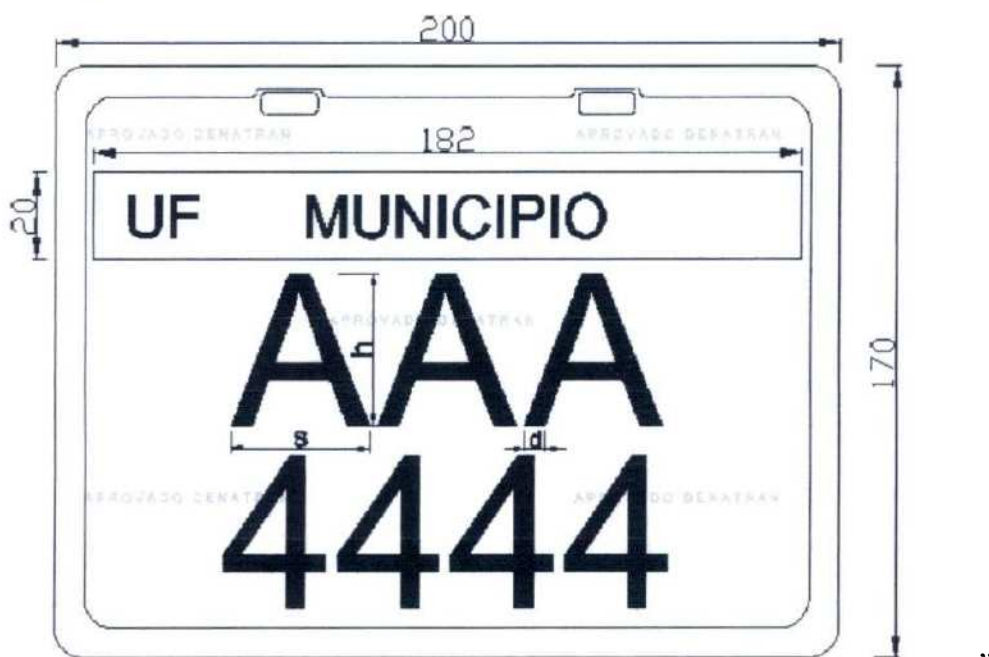
Figura nº 2

Art. 6º O item 11 do Anexo da Resolução nº 231, de 15 de março de 2007, passa a vigorar com a seguinte redação: